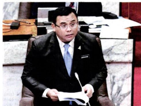
Amirudin says the state govt will give an exemption initiative of 100% to the development charge of RM500 for the construction of affordable homes

In his speech, he highlighted that the pandemic has had a significant impact on the lives of