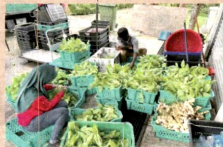
PKPS mempunyai mekanisme kawalan harga tersendiri memandangkan ladang mereka iaitu Selangor Fruit Valley di Bestari Jaya turut mengeluarkan hasil sayur-sayuran sendiri.

Tidak cukup dengan itu, mereka juga melancarkan kempen jualan mega