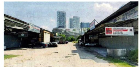
针对厂商核心业务以外范畴也要收取仓库、办公室、食堂等范畴的执照费, 市议员也认为不合理。

针对向不同业务范畴调整收费的做法, 市议员也尝试据理力争, 呼吁市议会或可选择逐步落实, 而非在此艰难时刻一意孤行。