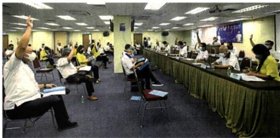
■出席代表們審議通過各項提案。

“雪州的经济复苏是我们的‘重中之重’，大家应总动员监督雪州国州议员、雪州各政府机构，是否有真正落实经济复苏措施！” 黃祚信指出，馬華雪州作為推動雪州發展的一股動力，必須在後疫情時代集思廣益、集體行動，扮演積極推動雪州的角色。 他說，雪州作為國家經濟火車頭，之隱患對各界各戶的收入有直接影響。 他強調，若有試圖“領乾糧”的議員，特別只有“一把口”的行動黨議員，他們有責任加以監督和揭發。 不要小看民生服務 “作為一個先進州，公共衛生事件不應發生，奈何在11月中，八打靈一帶發生霍亂，衛生部因此宣導大家注意衛生環境，這也是雪州政府的失敗，是掌管雪州公共衛生常務委員會的失敗！” 他也提醒黨員不要小看民生服務，並通過媒體揭發這些不負責任的議員或官方機構。