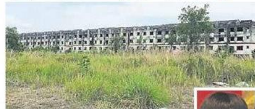
■武吉布伦东Super Taipan因发展商倒閉，屋业发展计划擱置近20年，地段更被荒废许久。

(蒲种28日讯)武吉布伦东Super Taipan屋业发展计划因发展商倒閉而擱置近20年，在这段期间，购屋者曾与各部门经过多番交涉，甚至集体抗议和投诉，但至今仍无下文，令他们深感不满，并要求雪州政府介入该计划，好让他们早日获得屋业单位。