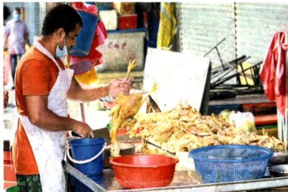
（格，确保消费者以合理价格购得。（档案照） ■雪州国内贸易及消费人事务部监督鸡肉价