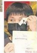
■缴还房贷25年 业主落泪。